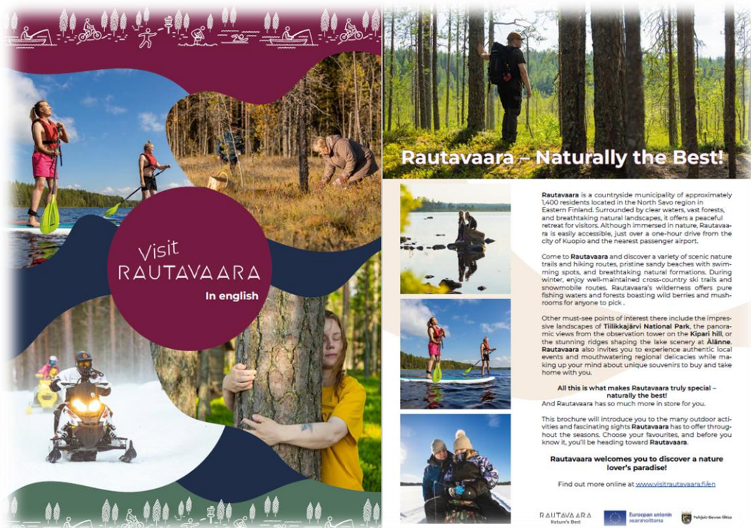
Kuva 2 Englanninkielinen Visit Rautavaara esite valmistui kesälle 2025

Esitteitä jaettiin messuilla ja tapahtumissa, matkailuneuvonnassa sekä yritysten omissa esitepisteissä. Englanninkielinen esite täydensi Visit Rautavaara -verkkosivuston kieliversioita ja paransi Rautavaaran saavutettavuutta kansainvälisille kävijöille. Esitemateriaali tuki koko hankkeen markkinointiviestintää ja vahvisti yhtenäistä Visit Rautavaara -ilmettä.