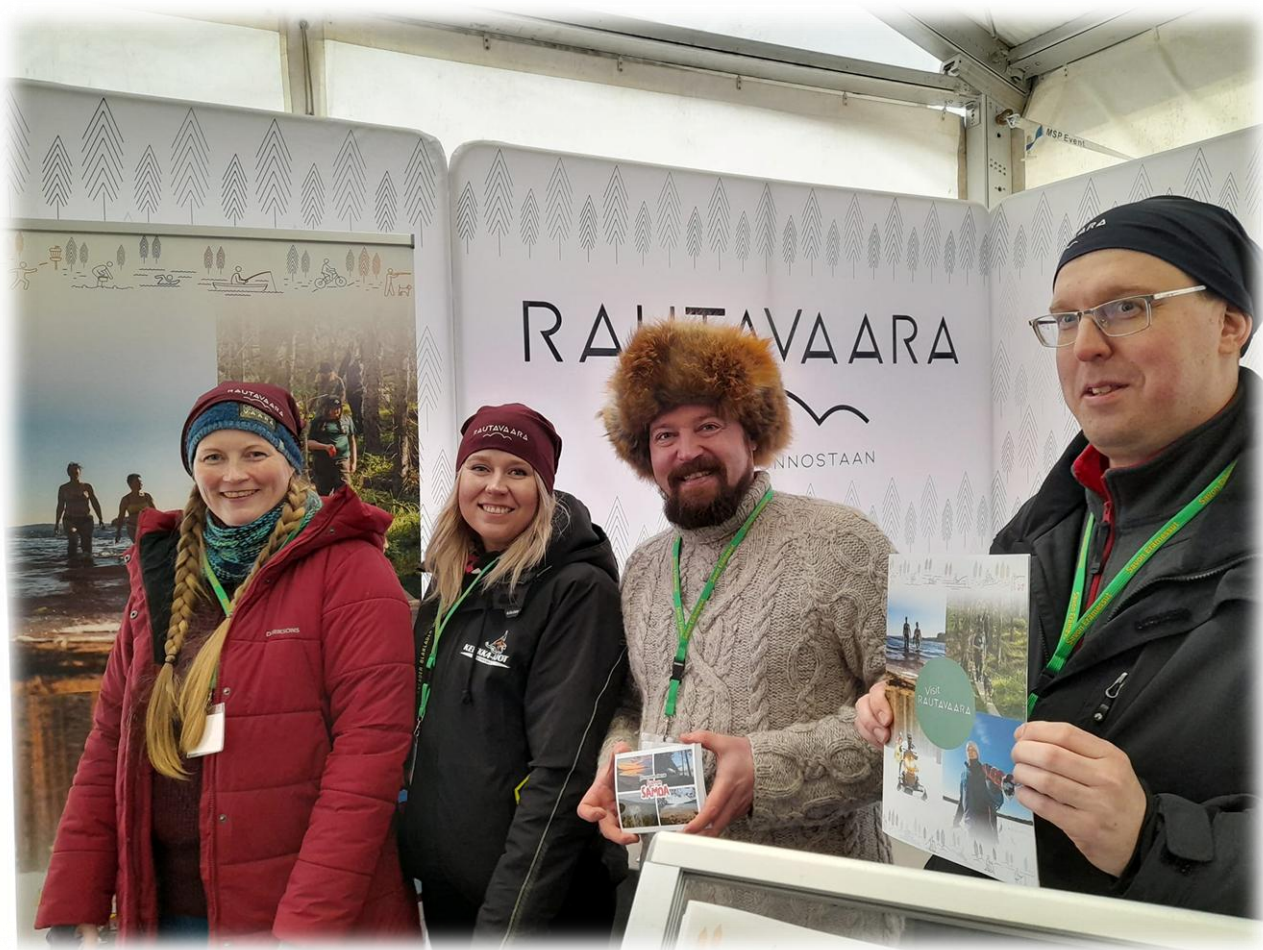
Kuva 4 Kunnan ja yritysten yhteismarkkinoinnin edustusta Erätaikamessuilla 2024