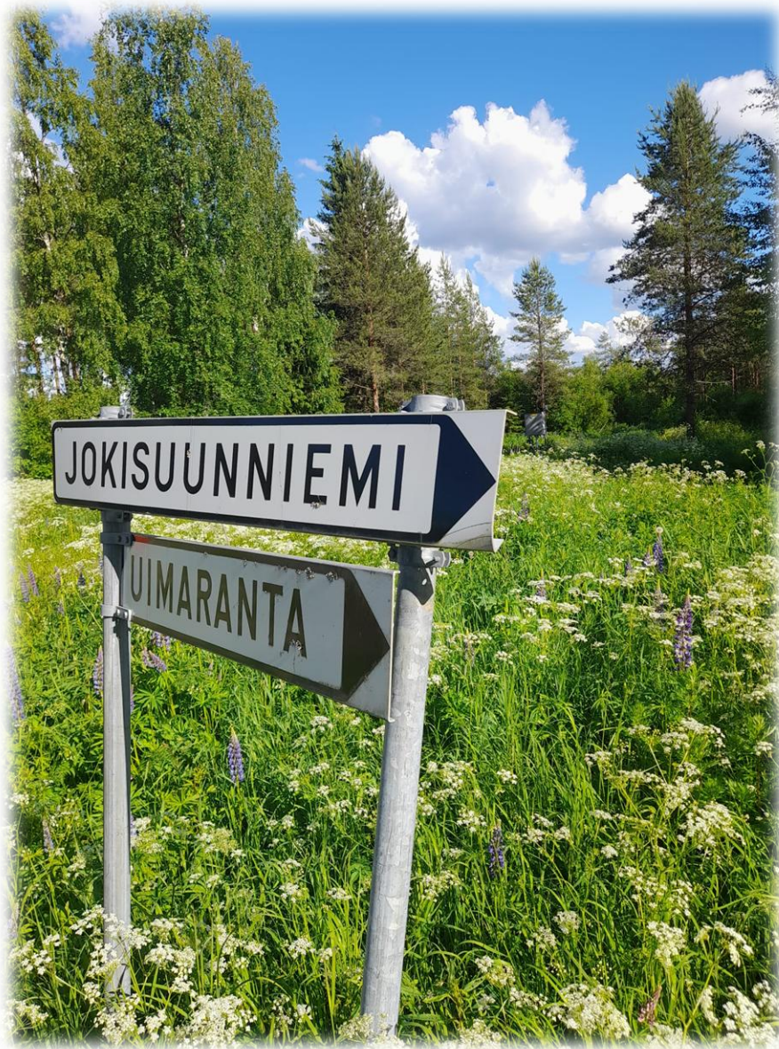
Kuva 6 Opasteita katselmoimassa kesällä 2024