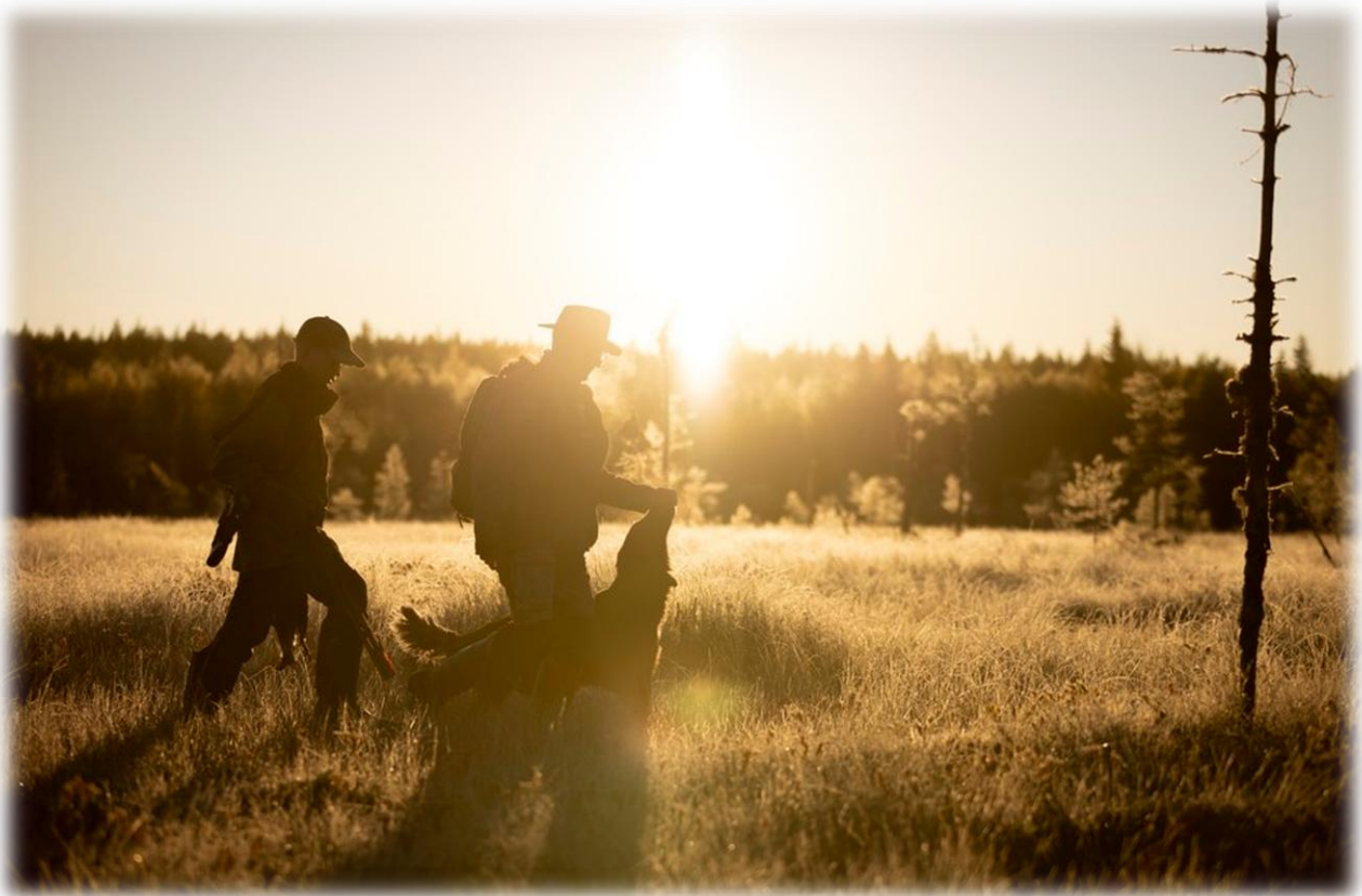
Kuva 8 Hankevalokuvauksia: Metsästys oli yksi kuvattavista aktiviteeteista. Matalansuolla teerijahdissa syksyllä 2024

Hankkeessa syntyneessä ideoissa mm. vieraslajien hävittämiseen sekä luontokohteiden virkistyskäytön kehittämiseen ollaan esittämässä määrärahaa Rautavaaran kunnan budjettiin.