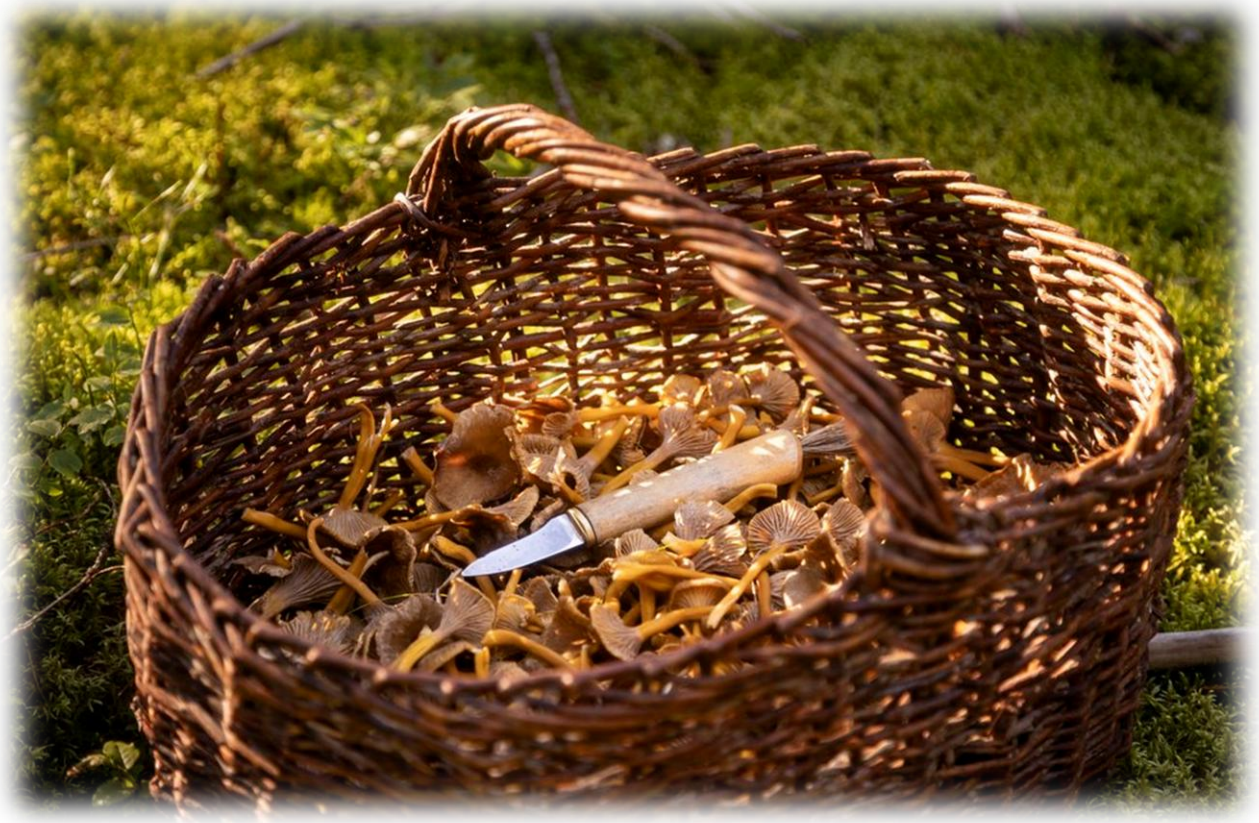
Kuva 7 Hankevalokuvauksia: Sienestys ja marjastus olivat osa kuvattavia aktiviteetteja syksyllä 2024

Suunnitelma toimii jatkokehityksen pohjana ja antaa kunnalle selkeän, toteuttamiskelpoisen rungon opastuksen parantamiseksi tulevaisuudessa investoinneissa. Opastesuunnitelman myötä syksyllä 2025 Rautavaaran kunta on alkanut uusimaan kohteiden viittosuuksia.