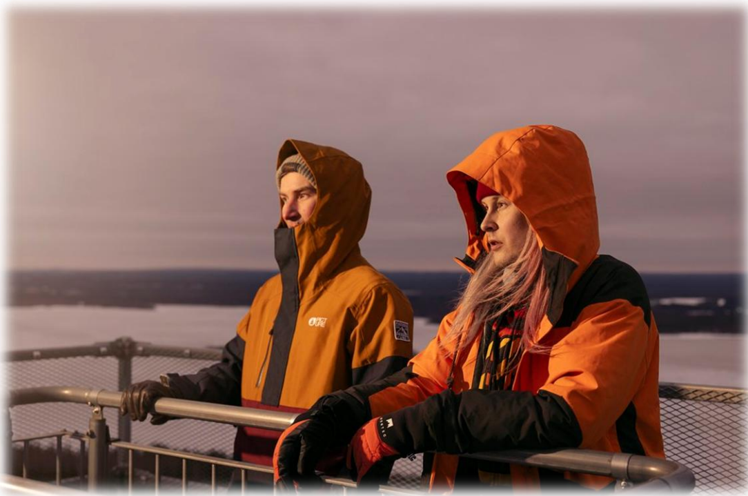
Kuva 10 Katseet tulevaisuuteen. Kuva Kiparilta ennen auringonlaskua 2024

Lopuksi lämmin kiitos kaikille hankkeen yhteistyökumppaneille ja asiantuntijoille – ilman teitä tämä hanke ei olisi saavuttanut näin monipuolisia ja pysyviä tuloksia. Yhteistyö jatkuu, ja sen pohjalta Rautavaaran matkailu voi kehittyä edelleen kohti vahvaa ja vetovoimaista tulevaisuutta.