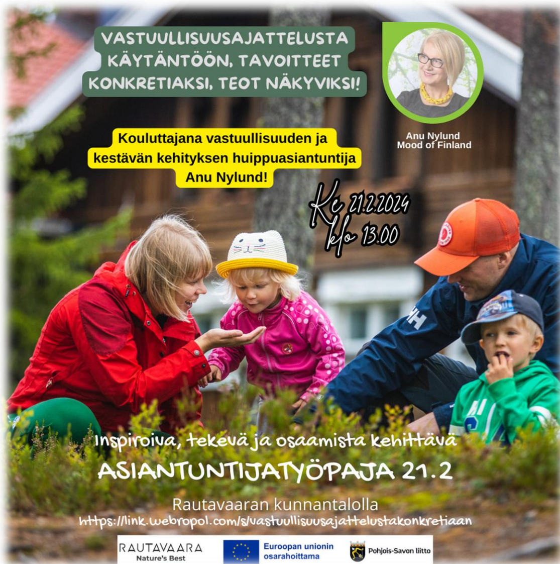
Kuva 3 Talven 2024 Asiantuntijatyöpajassa konkretisoitiin vastuullisuusajattelua.

Hankkeen aikana on pidetty 18 varsinaista verkoston kokoontumista/työpajaa. Tähän ei ole luettu mukaan sellaisia kokoontumisia, jotka ovat hankehenkilöstön ja kunnan toimijoiden sekä sidostyhmätyötä tekevien välisiä kokoontumisia. Lisäksi kokoontumisia on ollut myös matkailuenglannin kurssin parissa.