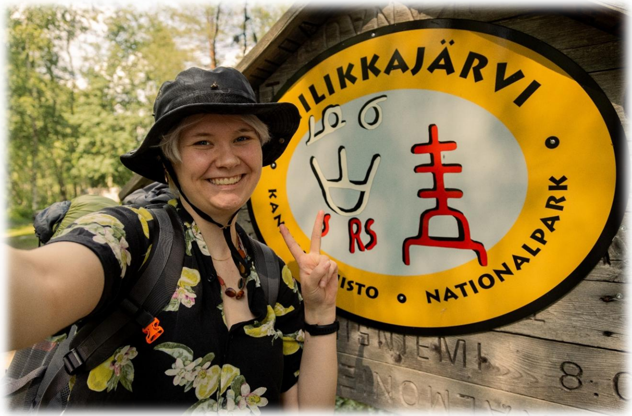
Kuva 9 Hankevalokuvauksia: Tiilikajärven Kansallispuistossa kuvattiin mm. patikointia, eräruokailua, rantaelämää ja luontoyhteyttä.

Hanke vahvisti Rautavaaran asemaa luontomatkailukohteena ja loi rakenteet, joiden varaan tuleva matkailun kasvu ja yhteistyö voidaan rakentaa.